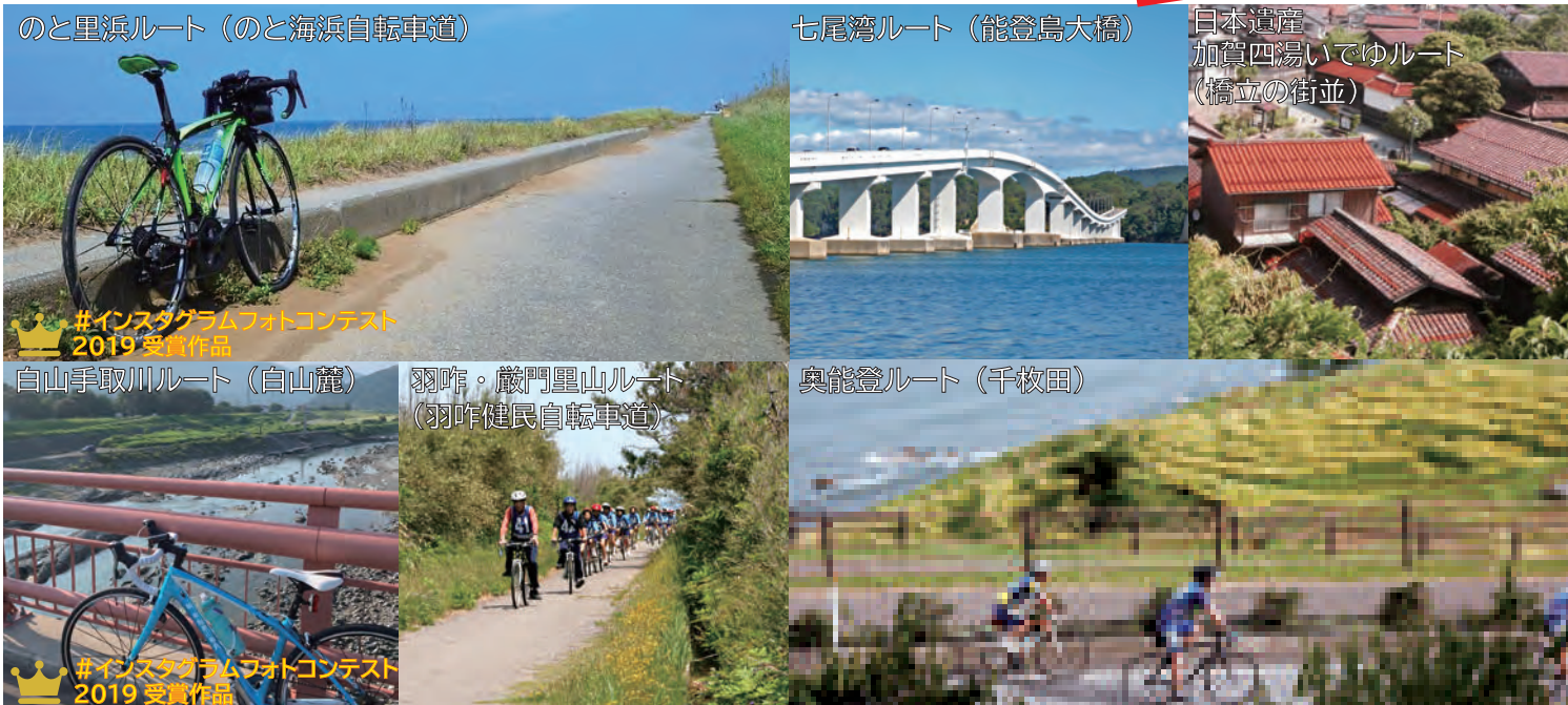
のと里浜ルート（のと海浜自転車道）